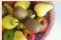
Mini panier FRUITS - 2KG