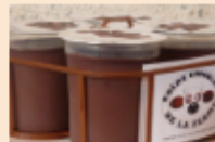
Crème Dessert Chocolat